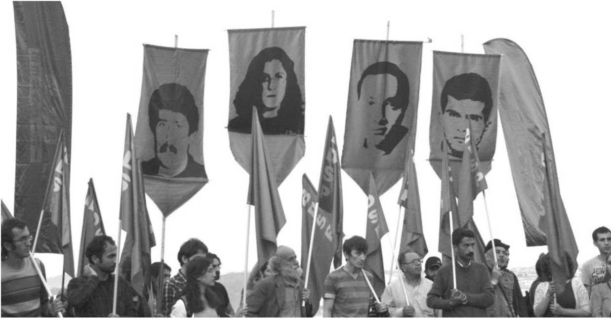
“Marksizmde aslanan onun devrimci diyalektiğidir”